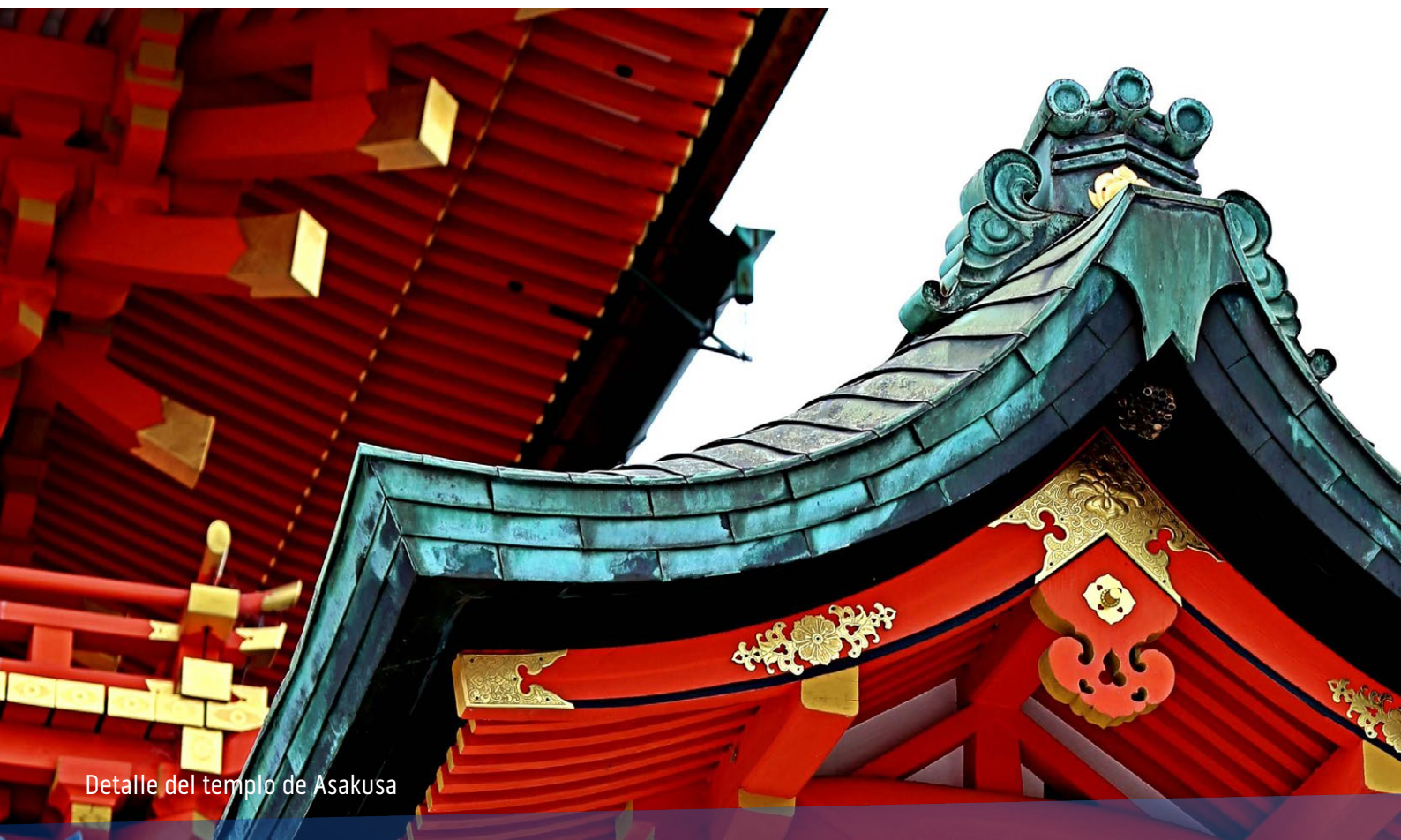
Detalle del templo de Asakusa